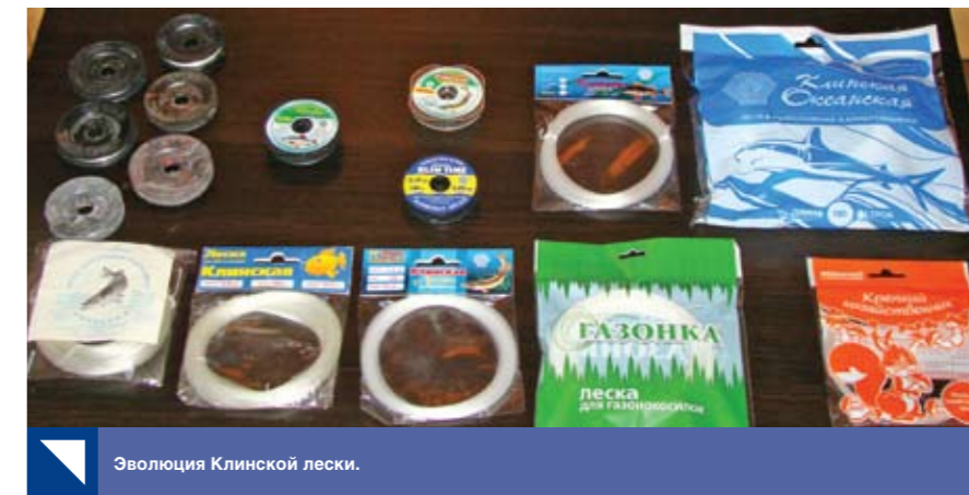
Эволюция Клинской лески.

А.М.: На сегодняшний день уже все размотчики, специализирующиеся на розничной расфасовке, переживают кризис. Даже те, кто свел свои накладные расходы к минимуму и разматывает самостоятельно в не отапливаемом гараже, не может выдержать конкуренцию с фальсифицированной продукцией из КНР, которая распространяется через уличные и вещевые рынки во многих регионах. После закрытия Черкизовского рынка в Москве многим оптовикам пришлось объясняться с постоянными покупателями по поводу торговли подделками. Понимание цены китайской продукции наступает, если проверить диаметр и длину лески в мотке. Результат поражает — недостача диаметра